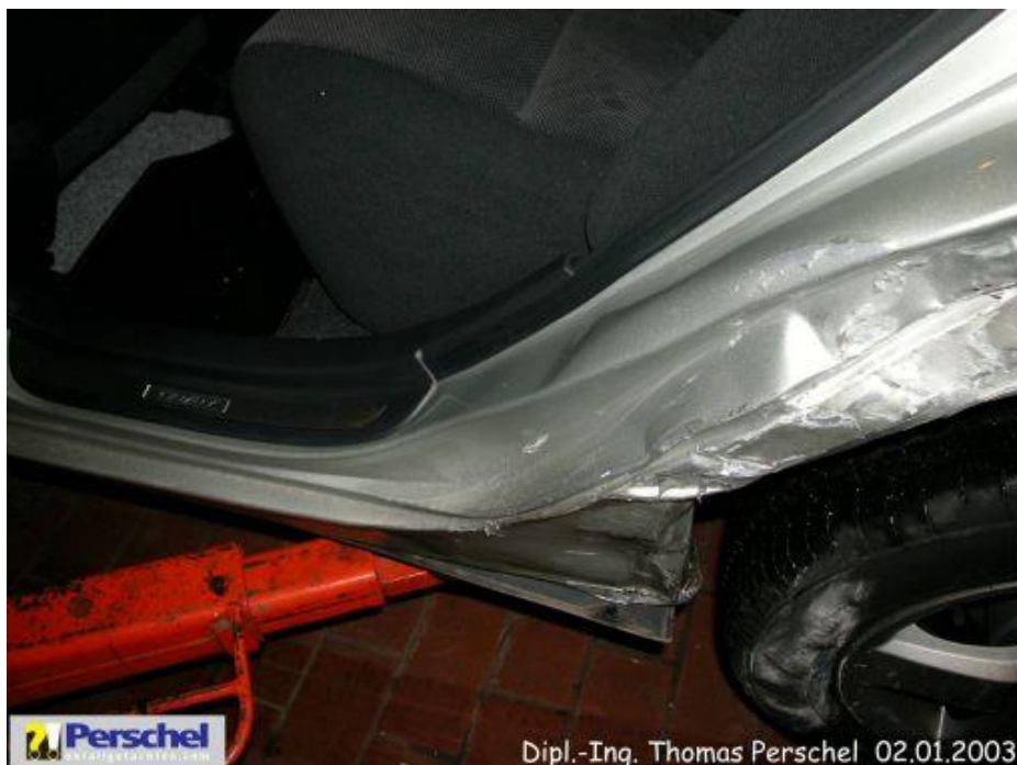
Bild 4: Kniestück Seitenwand, Schweller I im Anschlussbereich, Radkasten I a beschädigt