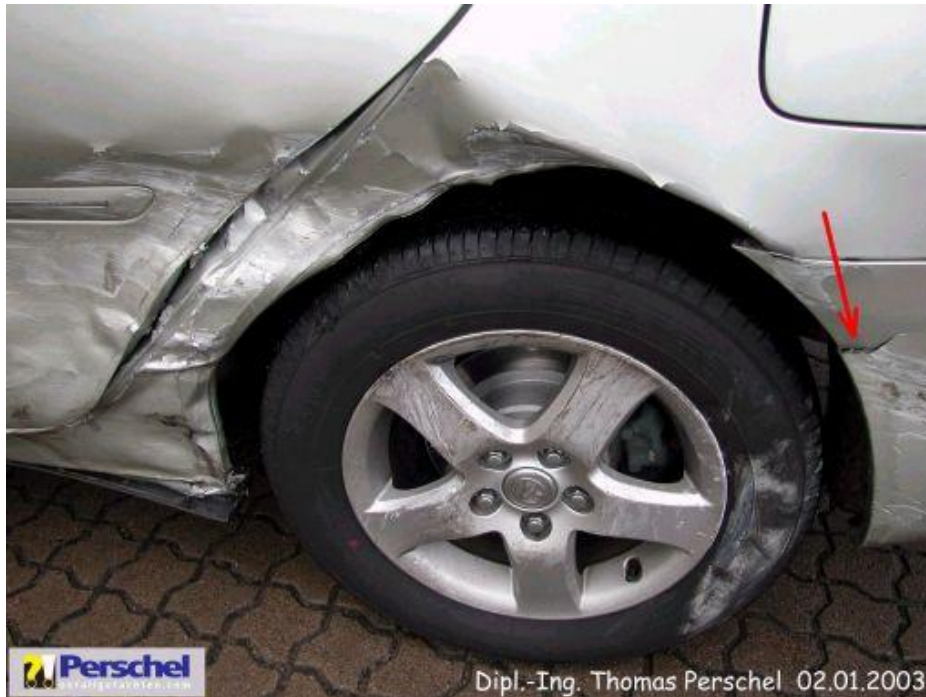
Bild 3: Tür h I, Seitenwand h I, Stoßfänger h, Radkasten h I a beschädigt